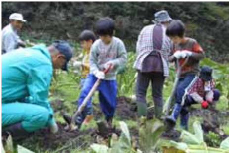
多彩な体験プログラムを提供

12月には、キャンペーンに携わっていただいた実践者の方や行政関係者等が集い、10周年キャンペーンを振り返る交流会を浜田市で開催。天候等によるプログラム変更や、地域全体の意識の醸成、効果的なアピール方法等、今後につながる課題の提起や、意見の交換を行いました。「来年度もやりたい!」。交流会ではそんな声も寄せられ、新しいプランの構想も生まれています。