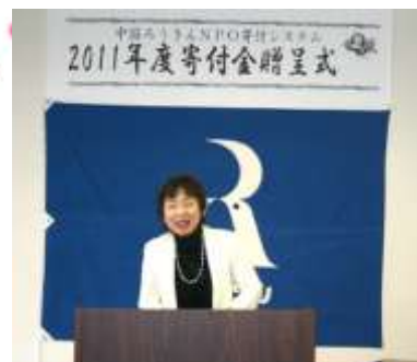
NPO 法人代表お礼の言葉 (NPO 法人サポートセンターどりーむ)