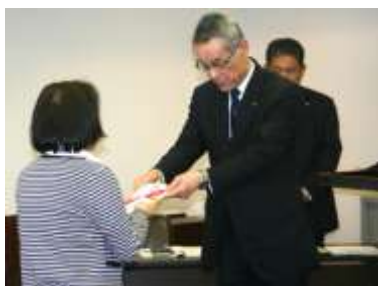
東部会場での様子

3月9日(金)、中国労働金庫島根県営業本部にて2011年度の寄付金贈呈式を行いました。8団体のうち7団体が出席し、県西部で活動するNPO法人アンダント21には3月15日(木)に中国労働金庫益田支店で贈呈式を行いました。(配分団体は先月号 Vol. 47 をご覧ください)