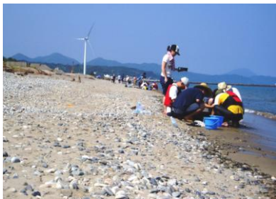
ハマグリ稚貝一斉調査の様子

宮崎に進学時、大学仲間と「みどりの会」を発足。役場とも協力して、城下町として古くから残る民家の生垣を守ろうと剪定作業を行った。社会貢献というほど大それたものではなかったが、地域のニーズと自分たちの出来ることが結びつき、地元の人との触れ合いが出来た。同時にその生垣の中に立派な植木を見つけるなどの楽しみも覚えた。その結果、剪定にとどまらず植木市の管理の手伝いなどの活動も増えた。長く続けていけたのは「自分たちのペース」で「楽しく」やっていけたからこそ。