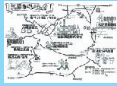
好評の「工房めぐりマップ」最新版

そんな時、都内の百貨店から取り扱いの依頼がきた。少しずつ市場が広がっていき「自分にもできる事かもしれない」と徐々に家業への思いが募っていった。Uターン後は美術館の館員をしながら鍛冶工房の手伝いをしていたが、今は鍛冶に全力を注いでいる。